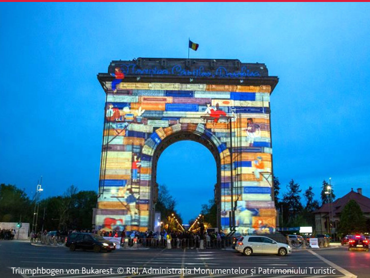
Triumphbogen von Bukarest.